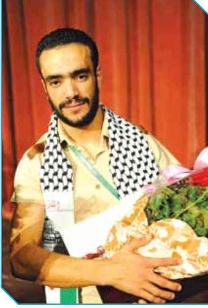
جمعها: حسان مرابط - فيصل شيباني - عبد العالي مزغيث - نادية سلطاني - حنان حملوي

التتويج فاجأني، وأنا سعيد لثقة لجنة التحكيم، وأشكرها على هذا التتويج.